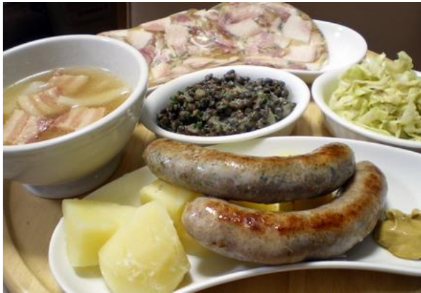
※ スープに入ってる具にも着目